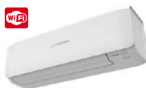
SRK 20~50 ZS-S