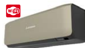
SRK 20~50 ZS-ST Titanium